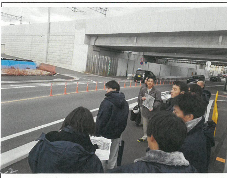
北九州市による 区画整理事業の説明の状況