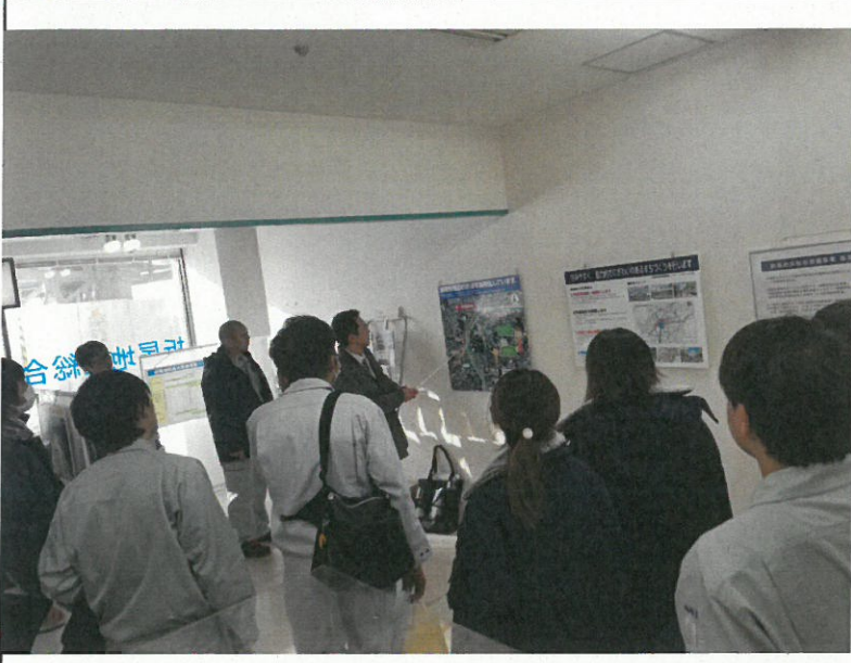
折尾総合整備事業全体の 概要説明の状況